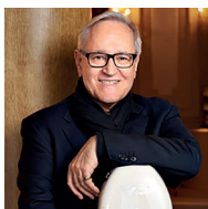
PROFESSORI DAVID GERINGAS

Il violoncellista e direttore d'orchestra lituano David Geringas appartiene alla élite musicale di oggi. Un insolitamente vasto repertorio dal primo barocco al contemporaneo testimonia la flessibilità e la curiosità dell'artista. Il suo rigore intellettuale, la sua versatilità stilistica, il suo sentimento melodico, e la sensualità del suo tono hanno meritato lodi in tutto il mondo. Studente del grande maestro Rostropovich e vincitore del Concorso Tchaikovsky nel 1970 può vantare una carriera eccellente: si è esibito in tutto il mondo con le orchestre più importanti e con i più prestigiosi direttori del nostro tempo. La sua discografia si avvicina a 100 CD. A questo aggiunge una prestigiosa carriera di insegnante, a Los Angeles, New York, Mosca, con brillanti studenti.